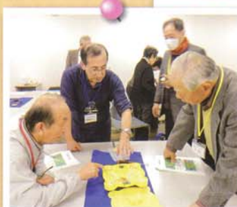
クラブ活動(おもちゃ病院)