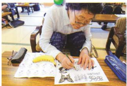
五所川原市介護予防教室