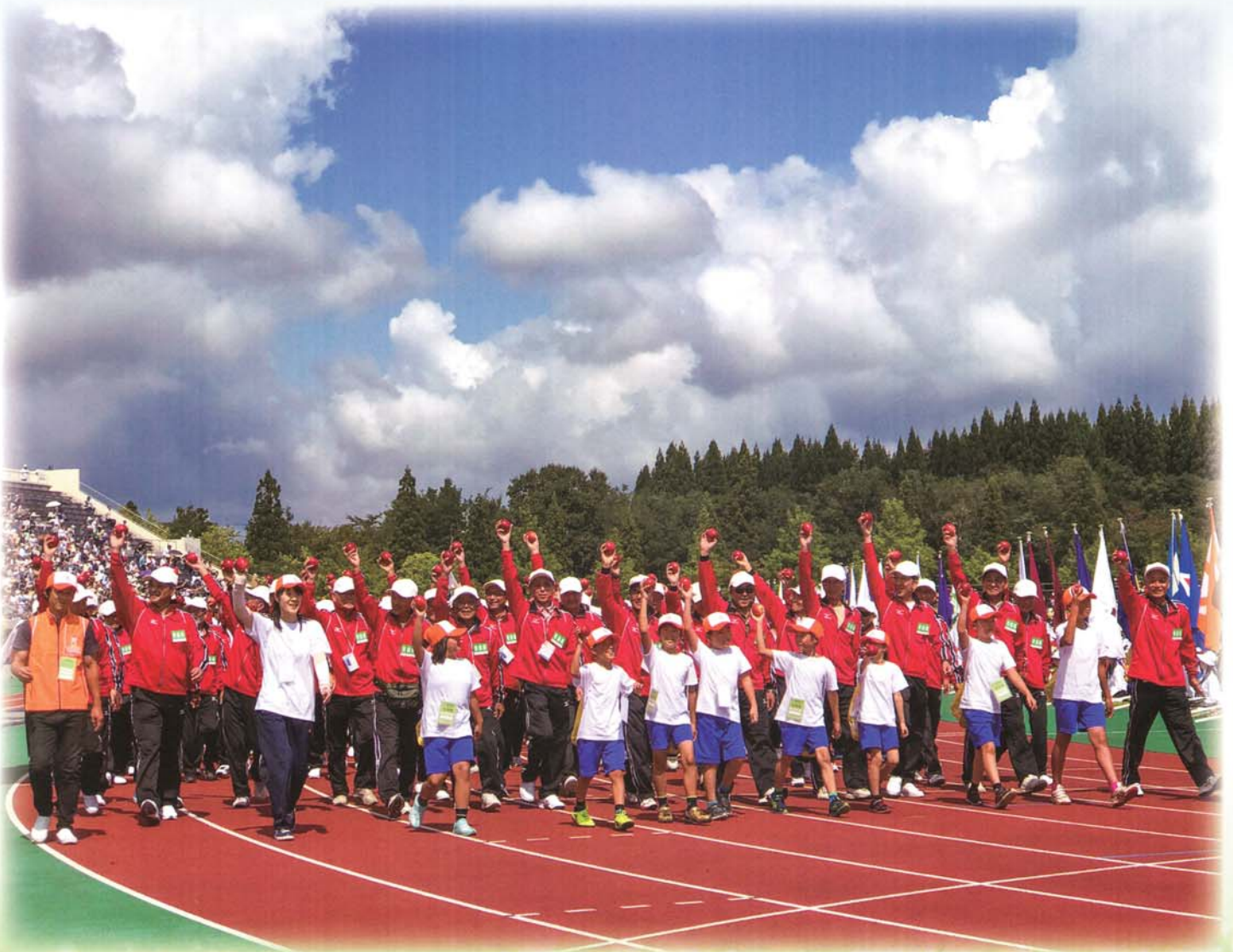
ねんりんピック秋田大会(2017年)での青森県選手団入場行進の様子