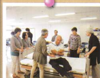
地域活動実習(介護実習)