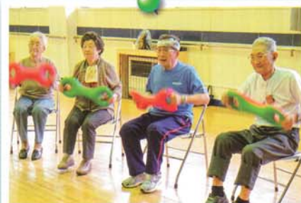
大鰐町介護予防教室