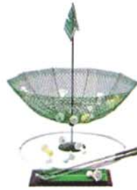
ターゲット・バードゴルフ