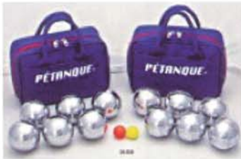
ペタンク(屋外用・室内用)