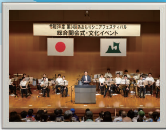
▲ 令和5年度 総合開会式の様子