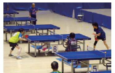
▲ ラージボール卓球