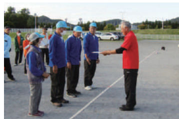
▲表彰式の様子(ゲートボール)