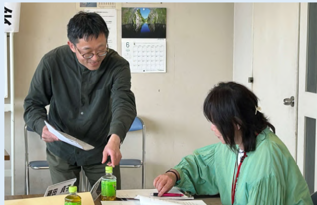
令和7年度シニアライター養成研修会の様子